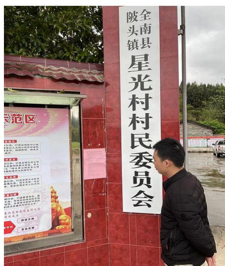
黄塘村、星光村张贴公告