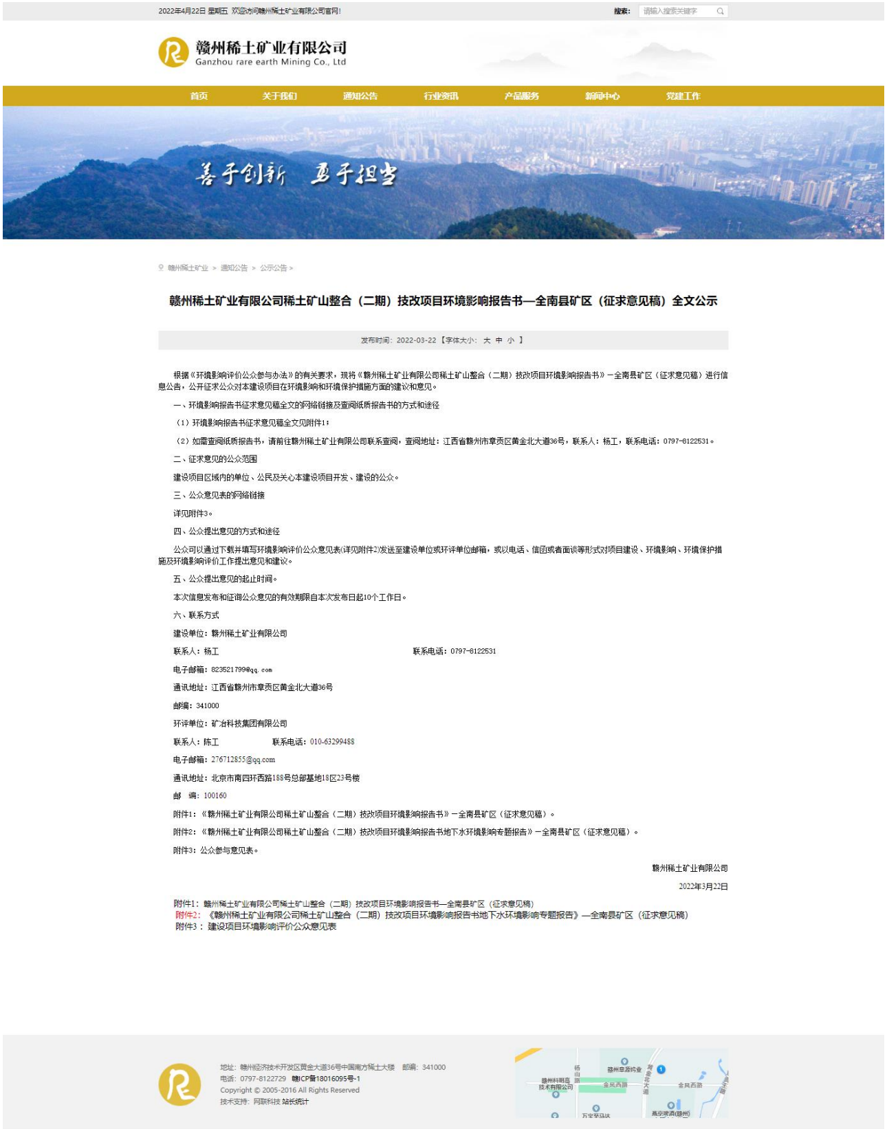
图 2 赣州稀土矿业有限公司网站网络公示截图（征求意见稿公示）