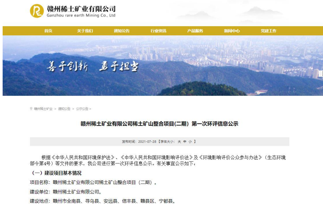
图 1 赣州稀土矿业有限公司网站网络公示截图（第一次信息公示）